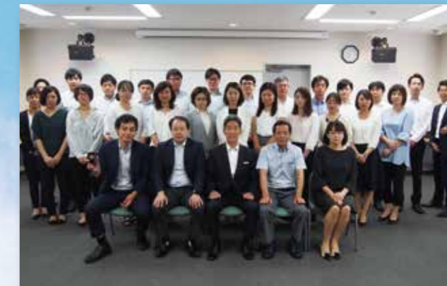
2019年8月 エスティコンサルティング(株)本社にて

エスティコンサルティング株式会社との経営統合後の新生かがやきグループは、個人事業主、中堅・中小企業及びパブリックセクターをご支援する日本を代表する会計事務所グループを目指します。両グループの得意分野をそれぞれが活用し、不得意分野を相補い、提供サービスのメニューや品質向上を今まで以上に拡充させることを目指します。私たちのこれからのどうぞご期待ください。